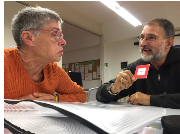
Dos alumnes treballant junts

Incorporem l'alumne en un grup adequat a les seves necessitats i en fem el seguiment individual.