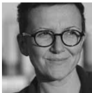
BRIGITTE VASALLO Espectora i Activista