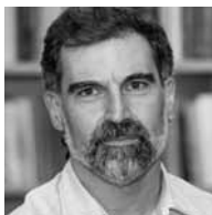
JORDI CUIXART President d'Òmnium Cultural